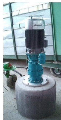
Socle pour tuyau en béton

Avec un montage élevé de l'entraînement de l'agitateur, le moteur et les connections électriques sont protégés des animaux, de l'eau, de la neige et d'autres salissures. Il est utilisé notamment dans les zones d'exercice en plein air des vaches, des cochons et des salles de machines. Ce rehaussement peut être créé meilleur marché sous votre propre régie, béton coulé sur place ou avec des tuyaux d'éléments en béton.