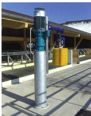
Colonne galvanisée, combinée avec brosse métallique