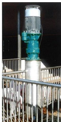
Colonne en acier inoxydable, combinée avec clôture de sécurité